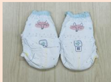
紙おむつを2枚用意します。