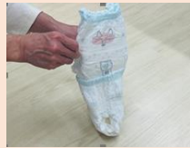
足を通す部分を隙間がでないようにずらして重ねます。