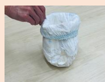
ウエスト部分を5cm程折り曲げて完成です。